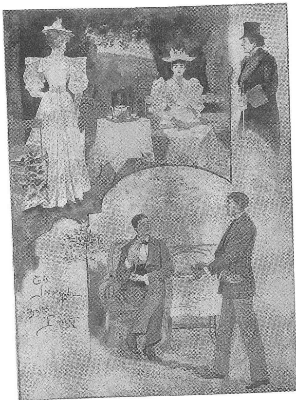
8. Illustrated London News , 23, Feb., 1895