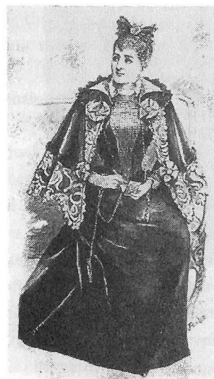
6. 30, March, 1895