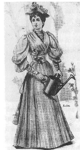
7. 2, March, 1895

Illustrated Sporting and Dramatic News .