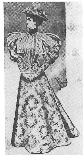
5. The Sketch , 20, Feb., 1895