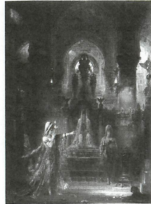
《ヘロデ王の前で踊るサロメ》1876年 油彩 アーモンド・ハマー・コレクション ロサンジェルス

原文では、ほとんどの部分が過去形の動詞で語られているが、モローの絵のくだりに関しては、現在形が用いられている。サロメの動作と共に、装身具の動き